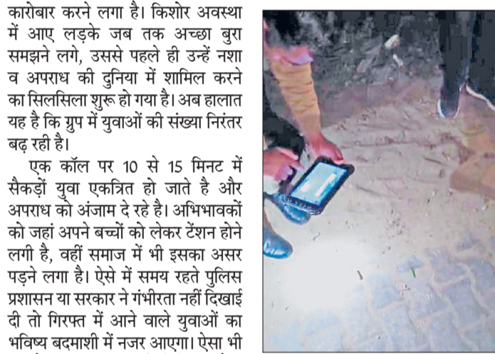
नारनौल। घटना के बाद सड़क पर पड़े गोली के खोल की तस्वीर उतारता पुलिस कर्मी।

पहले इनका काम लड़ाई झगड़ा कर अपना वर्चस्व स्थापित करना था। अब यहीं ग्रुप लड़ाई झगड़े के साथ-साथ नशा कारोबार करने लगा है। किशोर अवस्था में आए लड़के जब तक अच्छा बुरा समझने लगे, उससे पहले ही उन्हें नशा व अपराध की दुनिया में शामिल करने का सिलसिला शुरू हो गया है। अब हालात यह है कि ग्रुप में युवाओं की संख्या निरंतर बढ़ रही है।