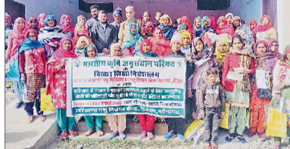
महेन्द्रगढ़। कार्यक्रम में उपस्थित महिलाएं।