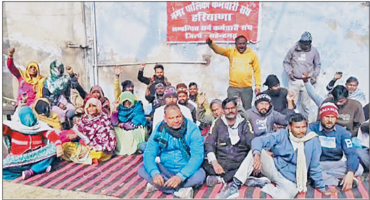
महेंद्रगढ़। नगर पालिका कार्यालय में नारेबाजी करते कर्मचारी।

नगर पालिका के सफाई कर्मचारियों का अनिश्चितकालीन धरना छठे दिन भी जारी रहा। इस दौरान कर्मचारियों ने नगर पालिका प्रशासन और सरकार के खिलाफ नारेबाजी की। हड़ताल के कारण शहर की सफाई व्यवस्था प्रभावित हुई है, जिससे जगह-जगह कूड़े के ढेर लग गए हैं और नालियां अवरुद्ध हो गई हैं। लोग सफाई व्यवस्था को लेकर नगर पालिका में शिकायतें दर्ज करा रहे हैं। बिगड़ती सफाई व्यवस्था के बीच डीएमसी रणवीर सिंह नगर पालिका कार्यालय पहुंचे। उन्होंने सफाई कर्मचारियों से बातचीत की और 10 दिन का समय मांगा। डीएमसी ने आश्वासन दिया कि 10 दिनों के भीतर जांच कर एरियर उनके खातों में डाल दिया जाएगा। हालांकि, सफाई कर्मचारी इस आश्वासन से संतुष्ट नहीं हुए। कर्मचारियों ने स्पष्ट किया कि जब तक उनके छह साल (2017 से लंबित) का