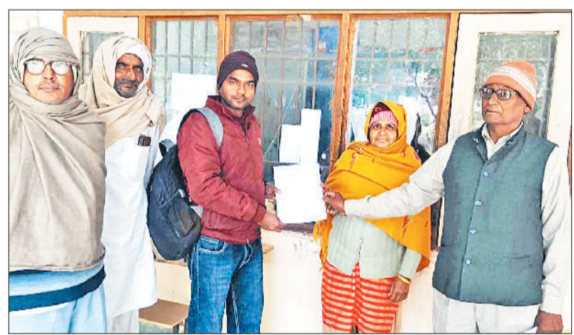
महेंद्रगढ़। तहसील कार्यालय में मकान की पेपर लैस रजिस्ट्री करवाते हुए।