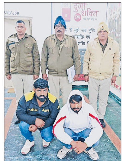
नारनौल। पुलिस गिरफ्त में आरोपित।