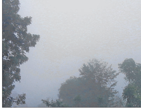
नारनौल। सुबह के समय आसमान में छाए बादल।

कृषि व पशुपालन के लिए: किसानों को फसलों में हल्की सिंचाई करने व पशुओं को ढके हुए स्थानों पर रखने की सलाह दी गई है। शीतलहर के दौरान जहां भी संभव हो हल्की और लगातार सतही सिंचाई पानी की उच्च विशिष्टता रखें। यदि संभव हो तो स्प्रिंकलर सिंचाई का उपयोग करें। शीतलहर के दौरान पशुओं को खुले में न बांधें व घूमने न दें। शीतलहर के दौरान पशुओं को बाहर न ले जाएं। पशुओं को ठंडा चारा व ठंडा पानी न दें। पशु आश्रय में नमी और शुष्क से बचें।