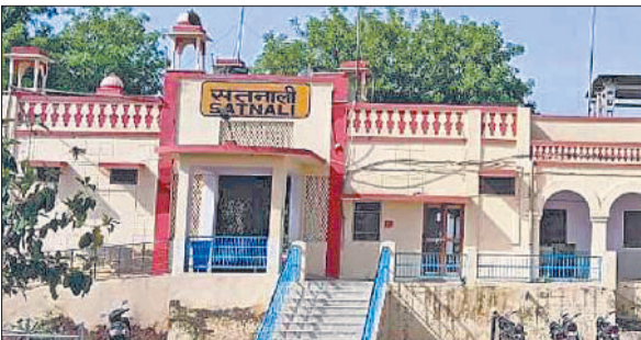
सतनाली मंडी। सतनाली रेलवे स्टेशन।